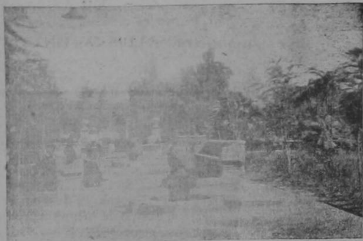
Paseo de sur a norte de la Gruta

Contórnese al Programa que publicamos en el número del viernes pasado, se llevó a efecto la solemne inauguración de la Gruta de Lourdes en la Parroquia de San Joaquín de Flores.